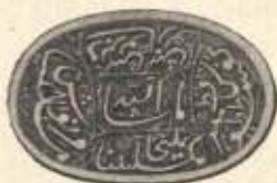
Fig. 1. Gemme. In der Mitte: Nach dem Willen Gottes. Ringsherum die Namen der Siebenschläfer Maksilmina , Yamlikha , Marnous , Messilyya , Dabarnous , Sabarnous , Cofasthethous , und ihres Hundes Kitmir . (REINAUD, Monuments Musulmans , II. Taf. J, Fig. 25.)

Ein syrischer Zauberspruch gegen das Weinen der Kinder beginnt mit den Worten: »In Vaters Namen etc. Jamlika, Maximus, Martalus, Arsanius, Jochannis, Sirapion, Denisius. Diese 7 Brüder sind als Helden heimgegangen.« 2)