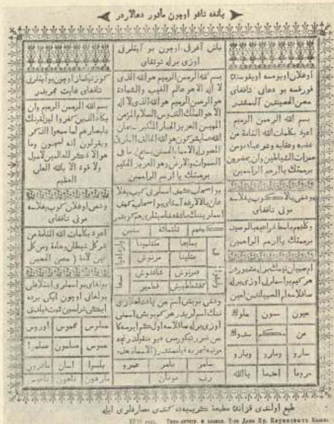
Fig. 6. Siebenschläfer-Amulett. Kasan, 18:22 cm.